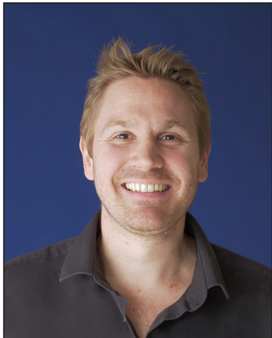
Rémi Fox

Site internet du compositeur remifox.net